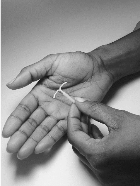
AVIBELA est petit

Deux fils fins sont attachés sur la tige (extrémité inférieure) d'AVIBELA. Les fils sont la seule partie d'AVIBELA que vous pouvez sentir quand AVIBELA est dans votre utérus, Cependant, contrairement au fil d'un tampon, les fils ne sortent pas de votre corps.